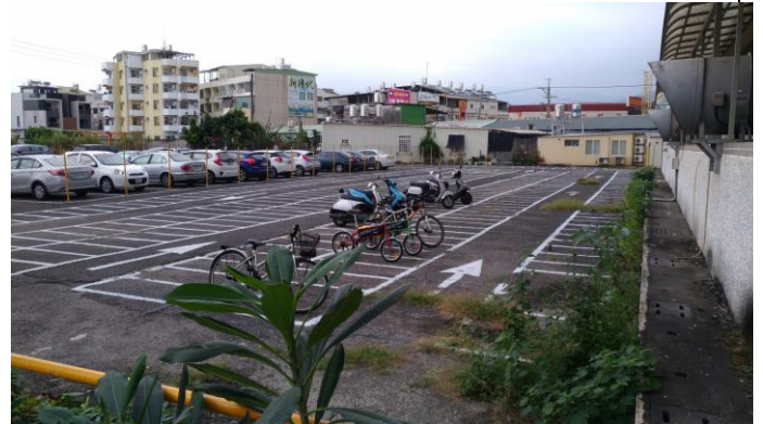
商學大樓東面停車場